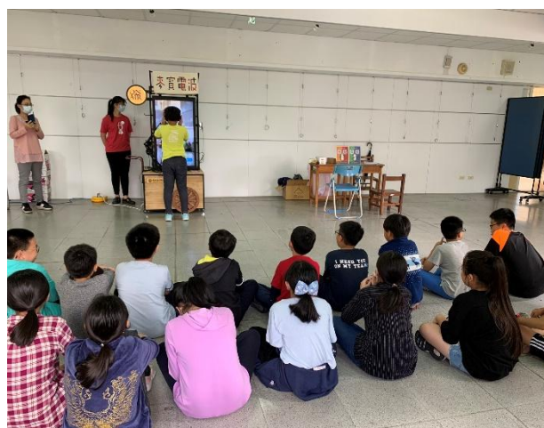
麥寶電波體驗活動紀實 1