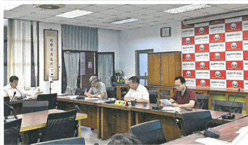
112. 2. 23教育儲蓄專戶審查會議