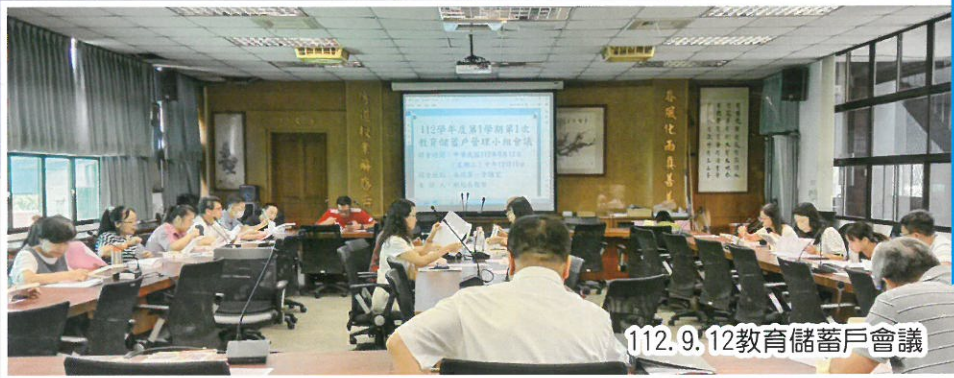
112. 9. 12教育儲蓄戶會議