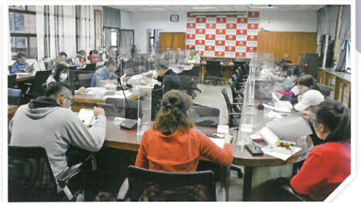
112. 9. 12教育儲蓄戶會議