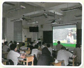
班級輔導活動-夢想