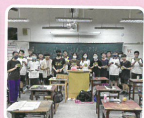
華山基金會校園志工團