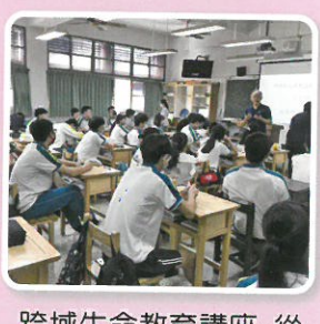
跨域生命教育講座-從畜牧汙水探討環境汙染