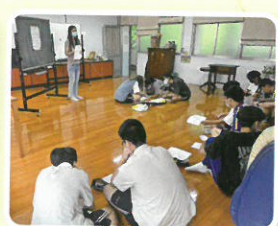
性別平等主題電影欣賞