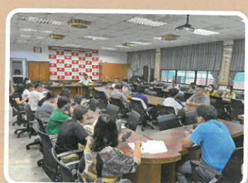
期初認輔學生會議